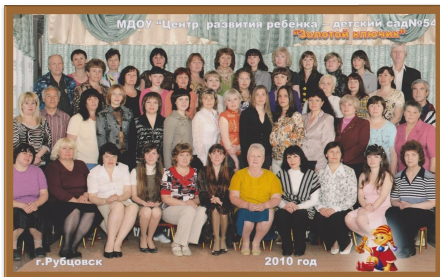
2000 – е годы