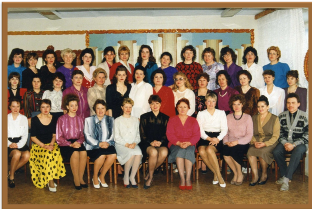
70 – е годы